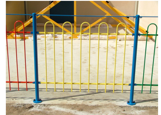
Grille manoir Hainneville