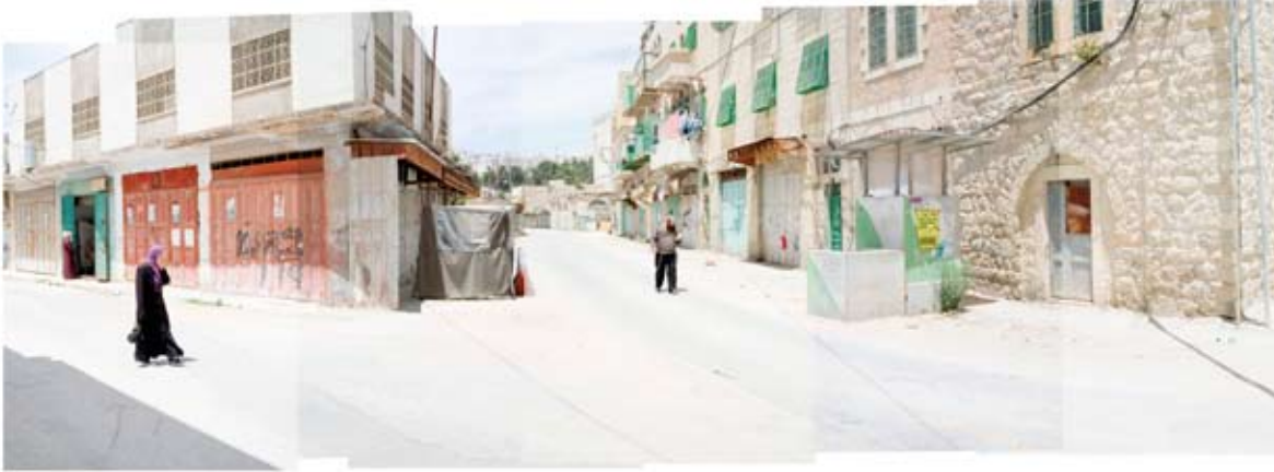
Alexis Codesse, Point de rencontre , photographie, 2009. Hébron, Territoires palestiniens.