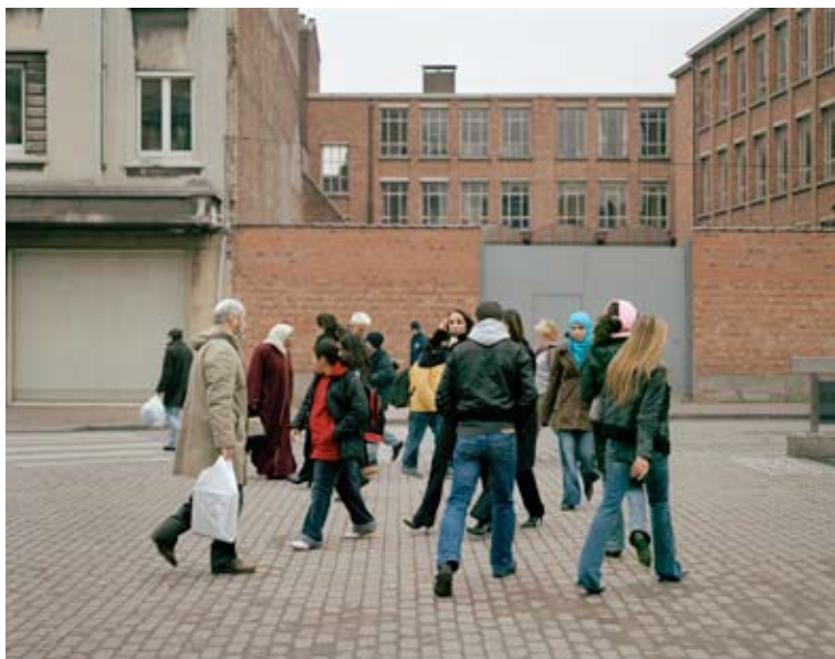
Sébastien Camboulive, Bruxelles , photographie, 2006. Collection Artothèque de Caen, acquisition 2010