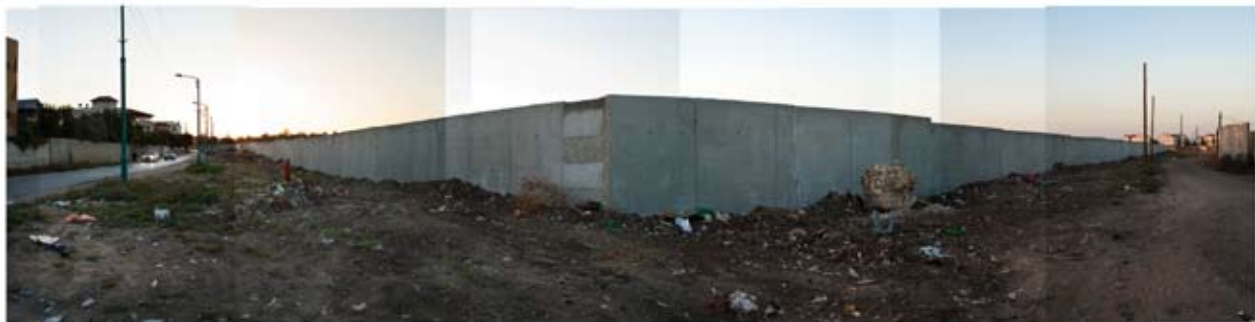
Alexis Codesse, Mur de séparation #2 , photographie, 2009. Mur «acoustique» érigé à la demande des habitants du Moshav Nir Zvi, village agricole juif, pour assurer une séparation physique et visuelle avec leurs voisins arabes du quartier déshérité de Pardes Snir, Lod, Israël, 2010.