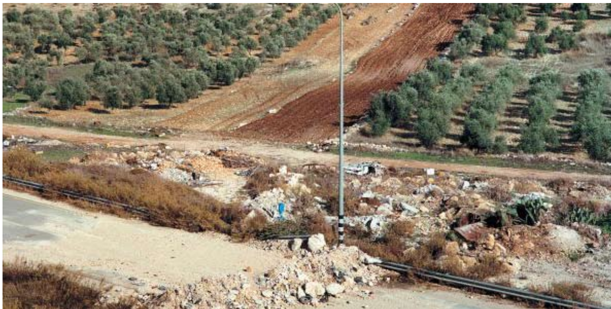
Sophie Ristelhueber, série West Bank, photographie, 2004.