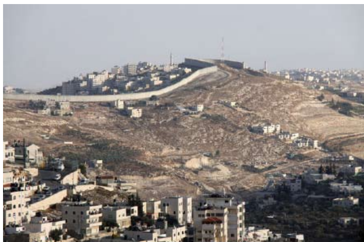
Mur de séparation entre Israël et la Palestine vu depuis Jérusalem.