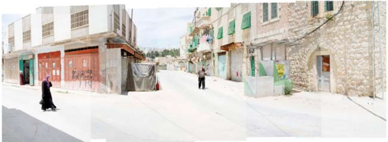
Point de rencontre Hébron, Territoires palestiniens, 2009

À propos de Border Lines , par Michel Poivert.