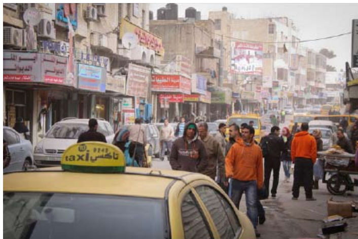
La vie fourmillante d'une rue de Ramallah.