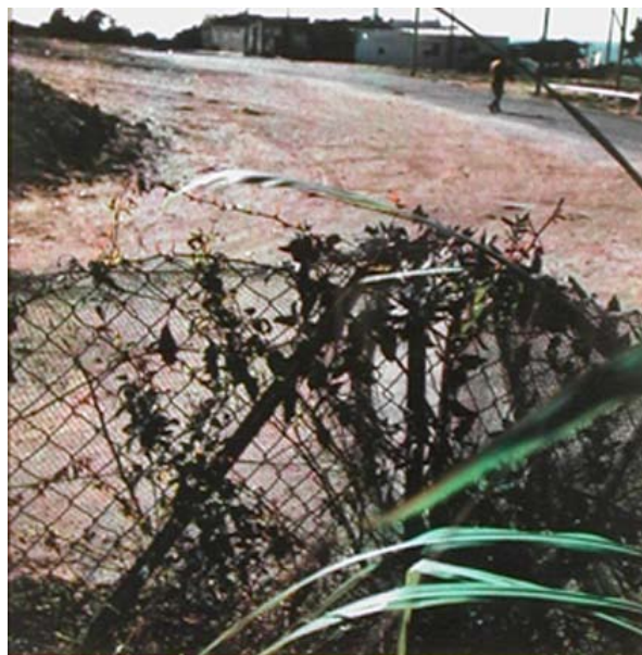
Didier Ben Loulou, sans titre , photographie, 1988.