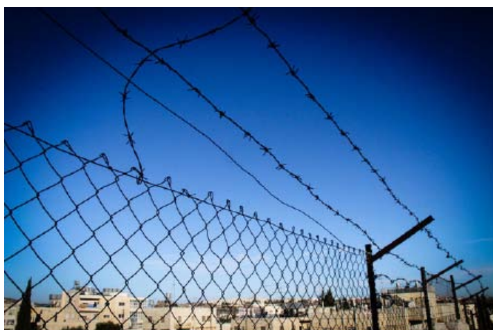
Près des camps de réfugiés d'Aïda, à Béthléem, ciel déformé.