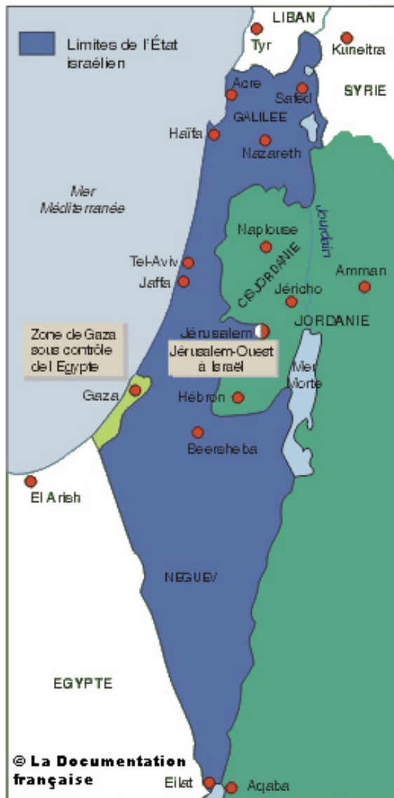
Israël avant 1967