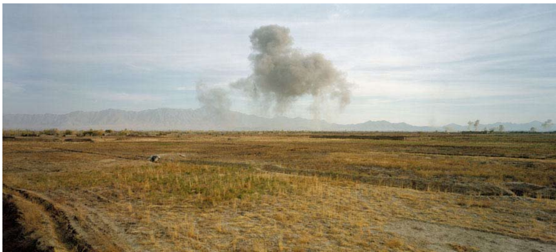
Luc Delahaye, US Bombing on Taliban Positions , photographie, 2001. 12 novembre 2001. Bombardement des positions des Talibans par un B52 américain dans la vallée de la Shomali, à 50km au nord de Kaboul.

(...) Instrument revendiqué d'une saisie neutre du réel, le format panoramique ne marque-t-il pas également une volonté d'ouvrir l'image aux puissances du narratif, de l'imaginaire et de leur insuffler une dimension dramatique, quitte à en brouiller le sens ? (...)