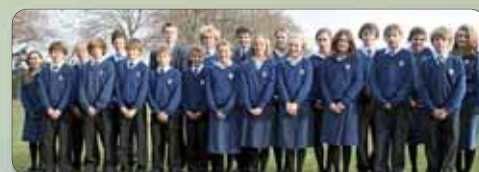
Séjour organisé par l'Aroéven Paris IdF

Documents demandés : Carte d'identité et sortie de territoire ou passeport, carte européenne de sécurité sociale.