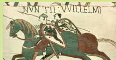
Séjour organisé par l'Aroéven Caen Normandie

Effectif : 24 jeunes, encadrés par une équipe de 4 adultes pour l'encadrement de la vie quotidienne et des animateurs spécialisés pour l'activité équestre.