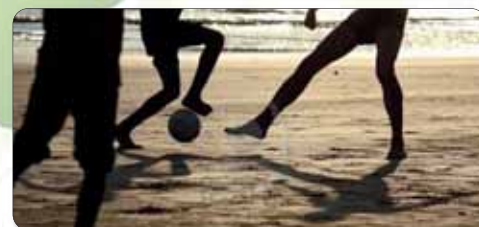
Séjour organisé par l'Association Passion Foot.

Le plus : De jeunes techniciens dans l'audiovisuel, un soir sur deux, réalisent et diffusent un journal télévisé qui te permettra de revoir tes journées d'activités. Sur place, un atelier audiovisuel te permettra de découvrir l'univers du cinéma et de la TV, et un DVD du séjour sera réalisé à la fin de la semaine.