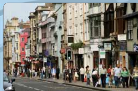
Séjour organisé par l'Aroéven Paris IdF

Formalités : Carte d'identité et sortie de territoire ou passeport.